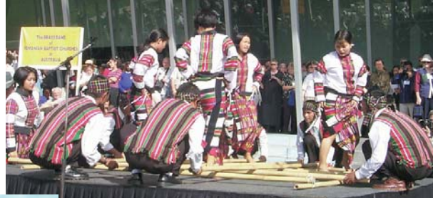
Indios del Noreste danzan en una reciente conferencia Bautista.