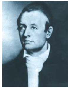
Ann y Adoniram Judson fueron figuras importantes para el crecimiento de la iglesia y el discipulado en Burma durante la primera mitad del siglo XIX.

Ellos han rechazados credos o declaraciones que comprometan la responsabilidad de cada creyente de interpretar las Escrituras con la guía del Espíritu Santo y dentro de la comunidad de fe, testificando así que Dios puede usarnos a cada uno de nosotros en el ministerio.