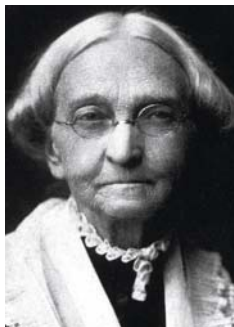
Joanna P. Moore estableció escuelas para liberar a mujeres Afroamericanas después de la guerra civil.

La misión Bautista Americana en todo el mundo es responder al llamado de Cristo de "hacer discípulos a todas las naciones." A través de los esfuerzos de nuestros misioneros y misioneras, en compañerismo con otros ministerios de evangelismo, salud, educación y desarrollo comunitario, damos a conocer el amor de Cristo en los Estados Unidos, Puerto Rico y alrededor del mundo.